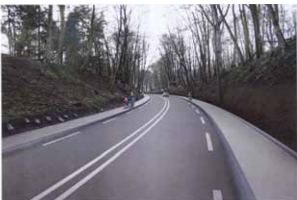
Ontwerp van de nieuwe situatie met vrijliggende fietspaden

“De beoogde ingreep sterk nadelige gevolgen heeft voor de natuur- en cultuurhistorische waarden van de Grebbeberg. Dit deel van de N225 loopt over de Grebbeberg. Omdat dit wegdeel in de Tweede Wereldoorlog het toneel vormde van de slag om de Grebbeberg, heeft dit wegdeel een belangrijke cultuurhistorische waarde. Naast het monument en de Erebegraafplaats die aan deze weg zijn gelegen, is de weg zelf een belangrijk element dat Nederland herinnert aan de meidagen van 1940. De weg is daarmee een fysieke markering van het begin van de Tweede Wereldoorlog in Nederland.”