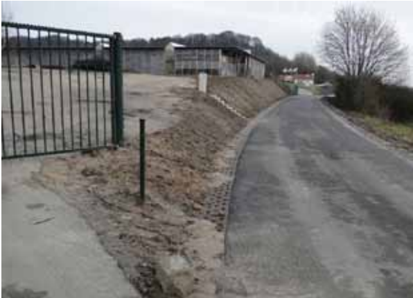
Bovenstaande foto: nabij het punt waar de EVZ schuin over het wegdek loopt richting uiterwaard en Rijnbrug.

maar ook de zuidhelling van het terrein westelijk van de tapijtfabriek weer met open grond is opgeleverd.