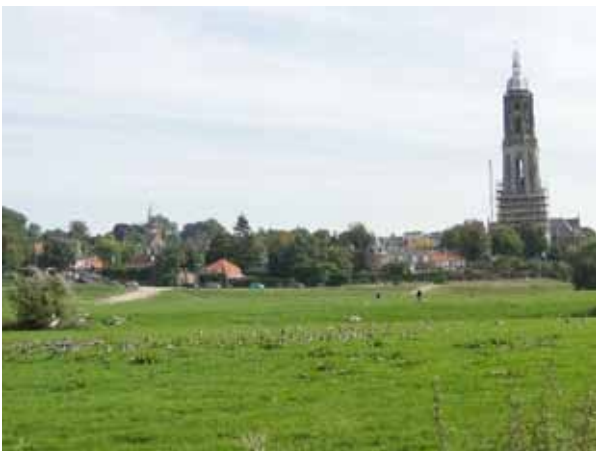
Cuneratoren Rhenen.

De WMR diende tegen al deze (ontwerp-) besluiten zienswijzen dan wel beroepen in.