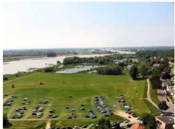
Uitzicht vanaf Cuneratoren Veerwei.

De gemeente wil in de uiterwaarden bij de stad Rhenen ruimte bieden aan recreatie en toerisme, landschap en natuur en wil daarbij een parkeerplaats aanleggen voor 103 auto's op de locatie van de Paardenmarkt in de Veerwei nabij de N225 en de Veerweg. Voor de realisatie daarvan zijn alle voornoemde besluiten nodig.