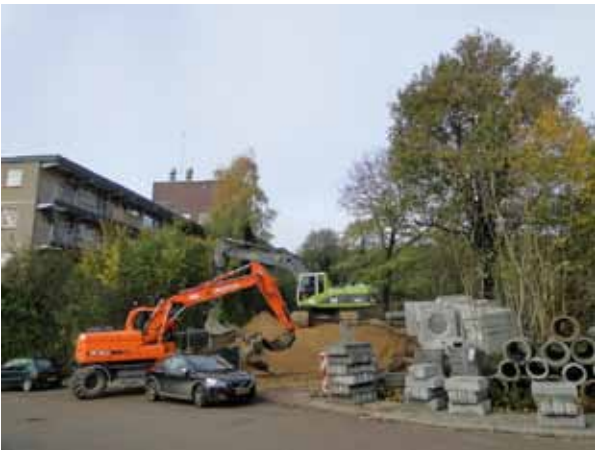
De Kleine Kampen, bulldozers aan het werk.

Er was eens een oud stadje ergens in het midden van een Koninkrijk, waar vanouds zich mensen vestigden. Het stadje lag aan een trage rivier en de heuvels waren bosrijk. Het was dan ook geen wonder dat er een jachtslot werd gebouwd waar edellieden zich verlustigden aan het jagen op het vele wild dat zich daar ophield. Maar de tijd schrijdt onverbiddelijk voort en het jachtslot verdween mettertijd. Omdat het zo een mooi plekje was, werd er ook veel gevochten.