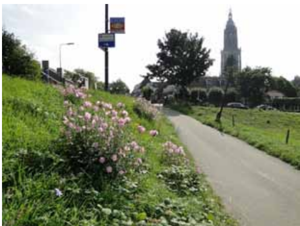
Vijfdelig kaasjeskruid Paardenveld.

De uitspraak door de Rechtbank Midden-Nederland zal van directe invloed zijn op de behandeling van ons beroep - later in 2014 - tegen de verleende vergunning Nbw bij de Afdeling bestuursrechtspraak van de Raad van State.