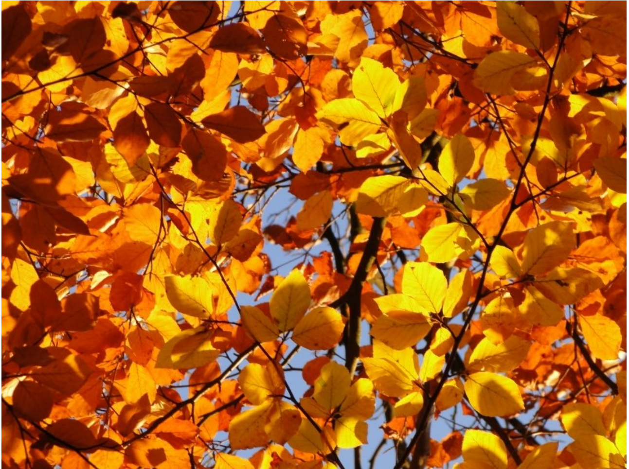
“Puur goud” van de Rhenense beuken.