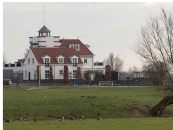
Ganzen voor Tante Loes.

nen' en het PlanMER. Tegen die tijd is er echter een nieuwe gemeenteraad gekozen en is ook een nieuw college van B&W agetreden en in die nieuwe situatie zullen wij bezien of het nodig is ook in beroep te gaan tegen het bestemmingsplan.