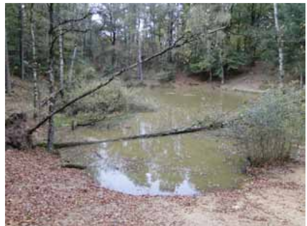
Hierboven een foto van de Leemkuil toen deze inmiddels was opgeschoond maar bij de eerste novemberstorm een omgevallen Ruwe berk te verdueren kreeg. De plantsoendienst heeft deze opgeruimd.

kele Kleine watersalamanders uit. Voor even want alle amfibieën zijn zwaar beschermd en een BOA (Buitengewoon OpsporingsAmbtenaar) zou me daarvoor kunnen beboeten!