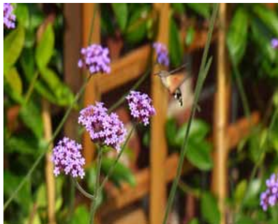
Kolibrivlinder op Verbena.