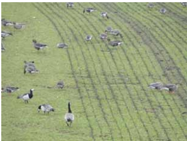
Foeragerende brand-, kol- en grauwe ganzen.

Omdat de locatie van de parkeerplaats en de uiterwaarden bij Rhenen deel uitmaken van het Vogelrichtlijngebied Uiterwaarden Neder-Rijn was het nodig om ten behoeve van alle besluiten een zogenoemde 'Passende beoordeling' alsook een PlanMER te maken. De Passende beoordeling en de PlanMER komen tot de conclusie dat de voorgestelde ontwikkelingen, inclusief de aanleg van de parkeerplaats, geen significante gevolgen zullen hebben voor de instandhoudingsdoelen van het Vogelrichtlijngebied. Volgens de Passende beoordeling is er ruim voldoende foerageergebied aanwezig om die instandhoudingsdoelstellingen voor met name de in de uiterwaarden overwinterende ganzen (kol- en grauwe ganzen) te behalen.