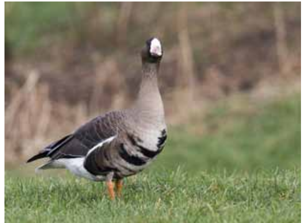
Kolganzen in de veerwei.

komen in de uiterwaarden Rhenen en in de Palmerswaard en dat enkele tientallen kolganzen foerageren op de Veerwei en de ijsbaan (gelegen tussen Veerweg en Rijnstraat), maar dat die aantallen te gering zijn om van invloed te kunnen zijn op de draagkracht. Wij bestrijden deze conclusie en dit vormt de kern van onze zienswijzen en beroepen tegen de besluiten van Rhenen en de provincie.