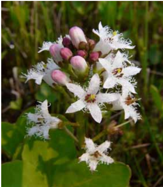
Waterdrieblad, een soort die nog vrij veel voorkomt in het trilveen.

nekomse Meent. In deze gebieden komen de laatste restanten trilveen en blauwgrasland voor die ooit grote delen van het Binnenveld hebben bedekt. De status van het gebied is zeer omstreden. De natuurgebieden zijn afhankelijk van de aanvoer van schoon kalkrijke grondwater. Door de lagere waterpeilen wordt het schone grondwater echter merendeels afgevoerd naar de Griff. Vandaar dat een adviescommissie eerder concludeerde dat het gebied alleen duurzaam behouden kon worden als het Griffpeil met enkele decimeters zou worden verhoogd.