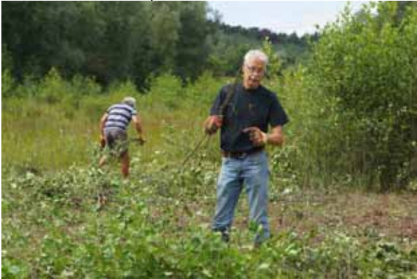
Vrijwilligers aan het werk zijn. De Natuurwerkgroep Kwinteloijen is door WMR en IVN opgericht om het recreatieschap te ondersteunen bij het beheer van het gebied.