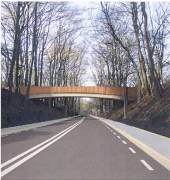
Ontwerp van het ecoduct over de N225.

en de verbetering van het kruispunt onderaan de Grebbeberg toe."