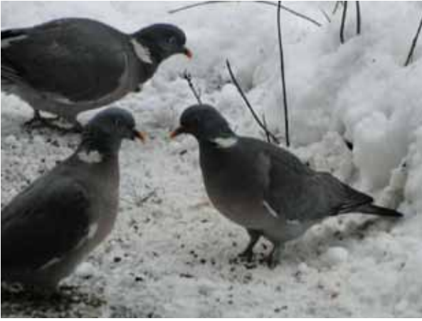
Houtduiven in de sneeuw.