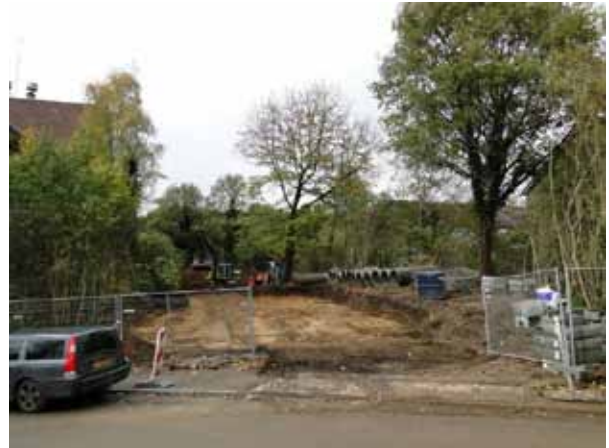
Tussenfase De Kleine Kampen.

mige plaatsen werd het warmer en droger terwijl tegelijkertijd door de hevige regenval overstromingen ontstonden. Gelukkig waren er nog genoeg bomen om te helpen deze problemen op te lossen.