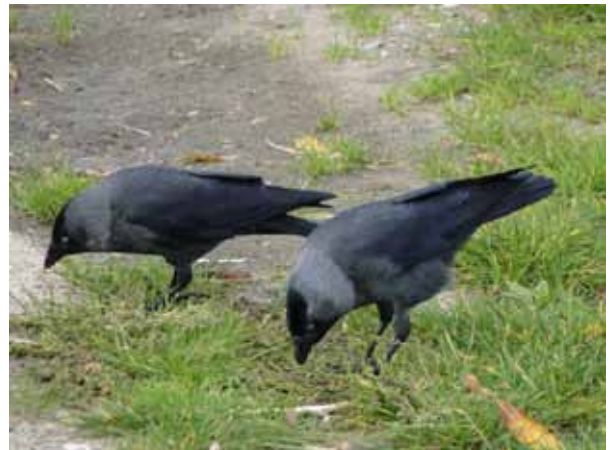
Favoriete vogel van Dirk Prins, tevens fotograaf