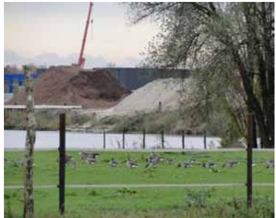
Grauwe ganzen.