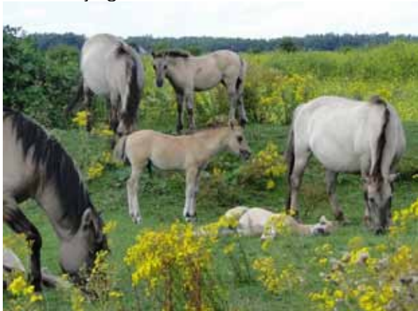
Konikpaarden in Palmerswaard.