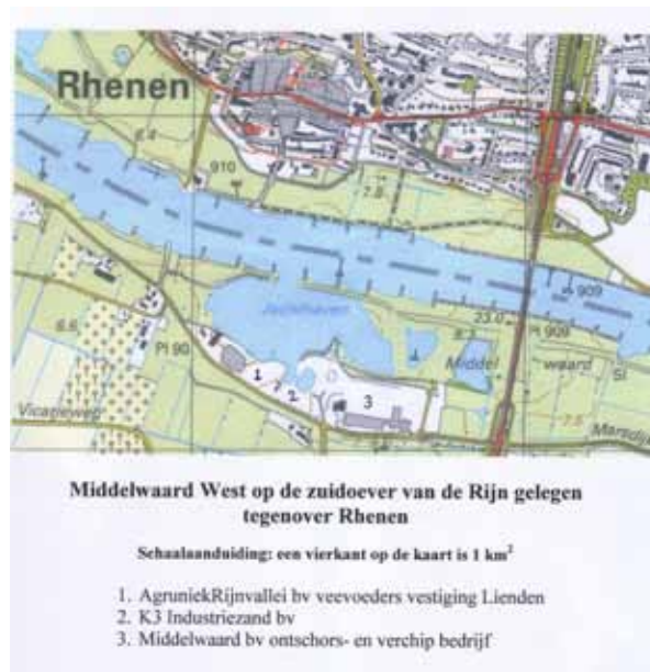
Kaart van het gebied waar het omdraait.

dit besluit van de raad een zware hypotheek op de verdere besluitvorming over het integrale bestemmingsplan. Daarom bepleitten het Comité Middelwaard West en wij bij het gemeentebestuur van Buren om alle belangen die bij dit plan spelen te benoemen en te wegen en daarvan uitgaande het nieuwe plan te maken.