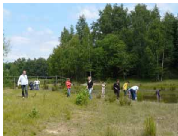
Kwinteloijen is een gebied waar recreanten ongedwongen kunnen kennismaken met de natuur.

weinig plekken in de omgeving waar kinderen nog op een speelse manier kennis kunnen maken met de natuur.