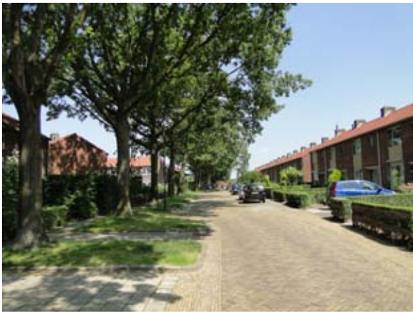
De Eikenlaan.