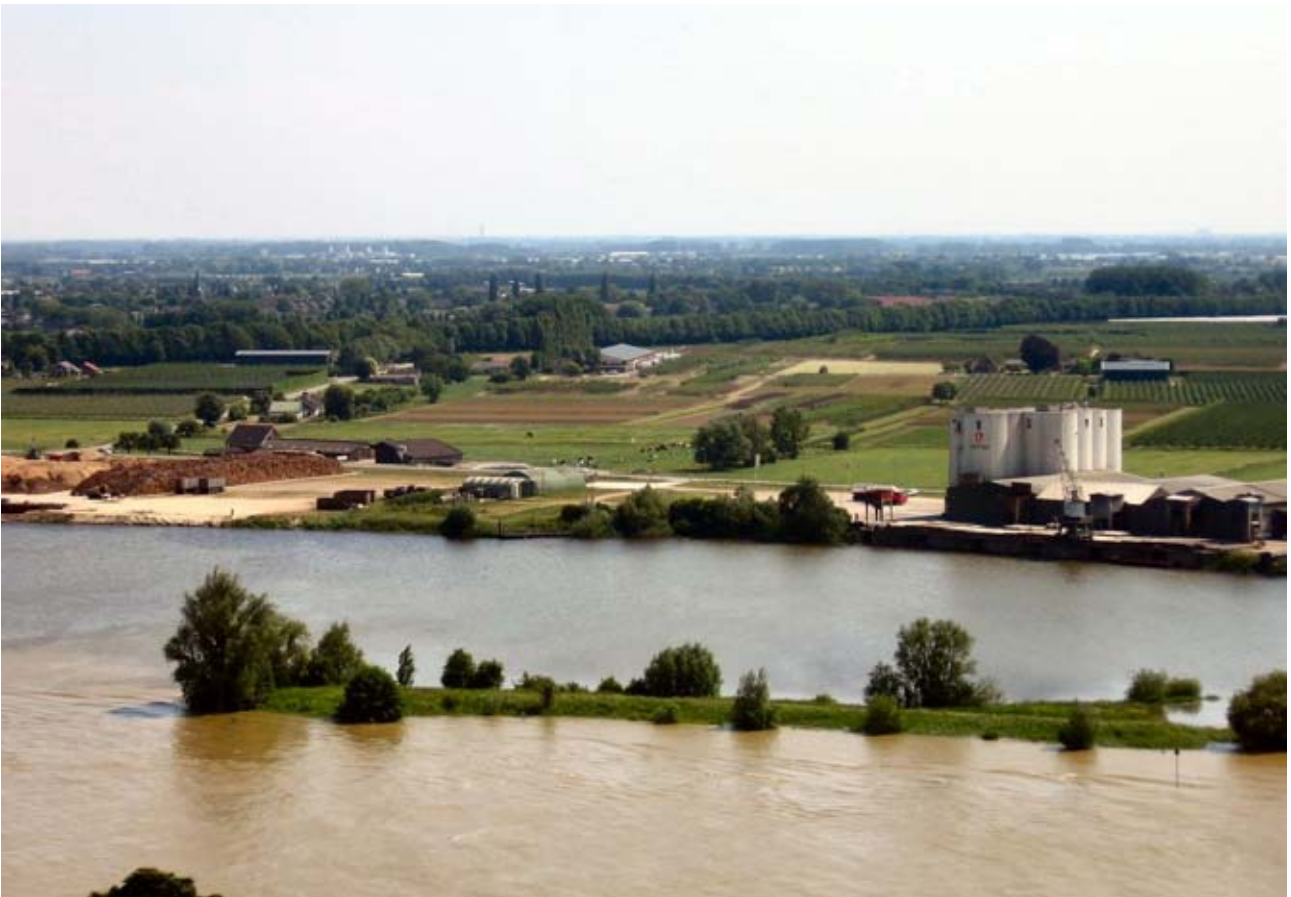
Overzichtsfoto vanaf de Cuneratoren in juni 2013: te zien is vrijwel het gehele industrieterrein met op de voorgrond de Rijn en op de achtergrond het binnendijkse gebied van de Marspolder