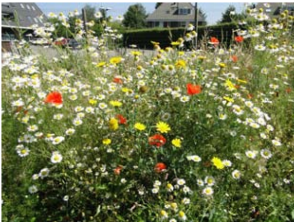
Akkerbloemmengsel nieuwbouw in Achterberg.

Als derde noem ik nog de berm langs Schoneveld in de nieuwe woonwijk in Achterberg waar nog in september volop het paars-rood van Knoopkruid te zien viel plus het geel van Gewone rolklaver en Geel walstro en ook de gehele zomer te genieten viel van een zeer kleurige en fotogenieke ingezaaide berm nabij het parkeerterrein tussen het winkelcentrumtje en de oude boerderij Schoneveld