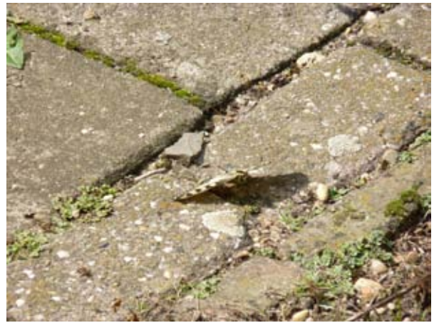
Koninginnepage in tuin van buren van Esther Slotboom.