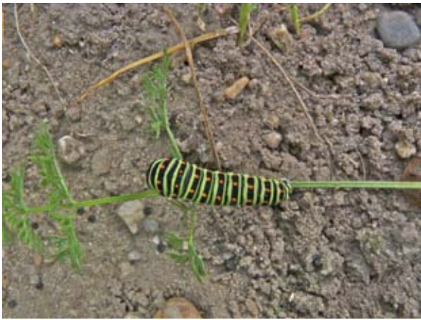
Rups van Koninginnepage op een wortelblad in de moestuin van Esther Slotboom.