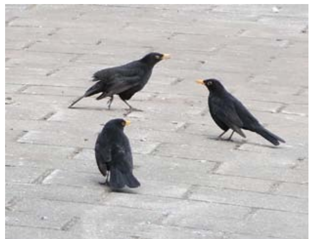
In conferentie zijnde of bakkeleiene Merels op de stoep van de Radboudweg.