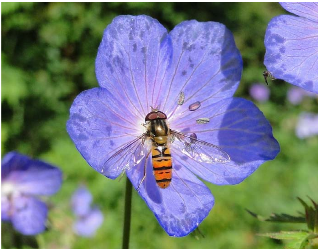
Snorzweefvlieg op Beemdooievaarsbek in eigen tuin van Dirk Prins.