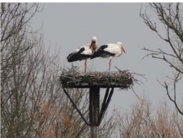
Ooievaars in de boomgaard van Rob Moret.

Ook in de gemeenten aan de overkant van de Rijn worden dijken en bermen in het