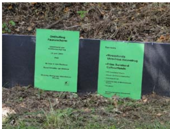
De bordjes bij de onthulling van het paddenscherm.

Het faunascherm kan de padden maar ook de overzetters een veel veiliger oversteek gaan bieden tijdens de jaarlijkse paddentrek, net als bij de Palmerswaard. En nu wordt het zelfs nog mooier voor de fauna ter plaatse. Onze goede samenwerking met de provinciaal fauna adviseur heeft ertoe geleid dat de provincie het plan heeft om nog voor het nieuwe jaar in het kader van het totale Grebbeberg-project twee passages in de vorm van faunatunnels in of onder de weg te plaatsen die aansluiten op het paddenscherm.