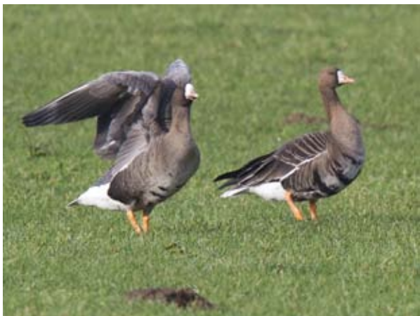
De Kolgans.

Zoals hiervoor aangegeven moet de behandeling van het beroep tegen de Nbw vergunning bij de Raad van State nog plaats vinden. De provincie Utrecht heeft inmiddels een verweerschrift tegen ons beroep ingediend.