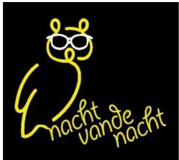
Nacht van de nacht op 25 oktober 2014

wegen vooral in de buitengebieden maar ook wel in de urbane omgeving. We realiseren ons dan vaak niet, los van het bewuste of onbewuste genieten van de (seizoens-