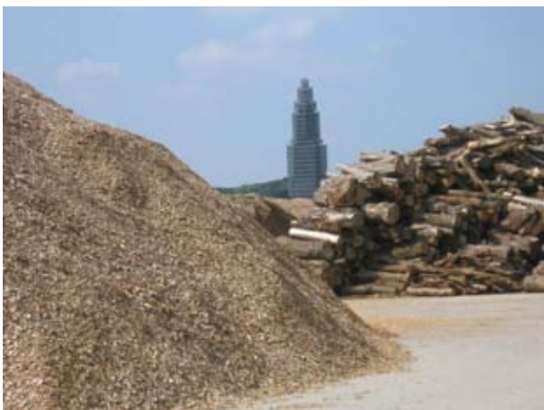
Cuneratoren tussen de hopen zaagsel door gezien op het terrein van houtversnipperbedrijf Middelwaard bv.

Conclusie: Aan de regel in art. 2.4.3 van de Beleidslijn Grote Rivieren 2006 kan in het havengebied niet worden voldaan vanwege de ligging en het in bedrijf hebben van de drijvende klasseerinstallatie in het havengebied door K3Delta met als gevolg een verslechtering van de ecologische toestand van het oppervlaktewater en onderwaterbodem in de haven.