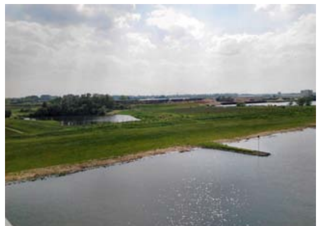
Foto van het industrieterrein genomen vanaf de Rijnbrug door Jules Scholten.

Conclusie: De besluitvorming over het bestemmingsplan Middelwaard West en de zwakke en kwetsbare beleidsmatige en juridische positie die het aspect landschap daarin heeft toebedeeld gekregen alsook de povere wijze waarop het beeld-kwaliteitsplan is ontwikkeld, vormen een duidelijk voorbeeld voor wat de Rijksadviseur voor het landschap in zijn advies (van 12 februari 2014 aan de Commissie voor de milieueffectrapportage) bedoelt met het gebrek aan ambitie en inzicht dat initiatiefnemer en bevoegd gezag veelal aan de dag leggen in de landschappelijke inpassing van ruimtelijke ingrepen.