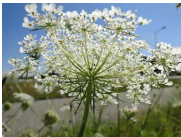
Wilde peen.

Iets minder rijk misschien is de bloei langs de N233 Cuneraweg naar Veenendaal. Van de Wilde peen, het Jacobskruid en Grote kattenstaart (de laatste in de droge greppel- sloot, met vlinders er op) heb ik aan de westzijde prachtige plaatjes kunnen schieten.