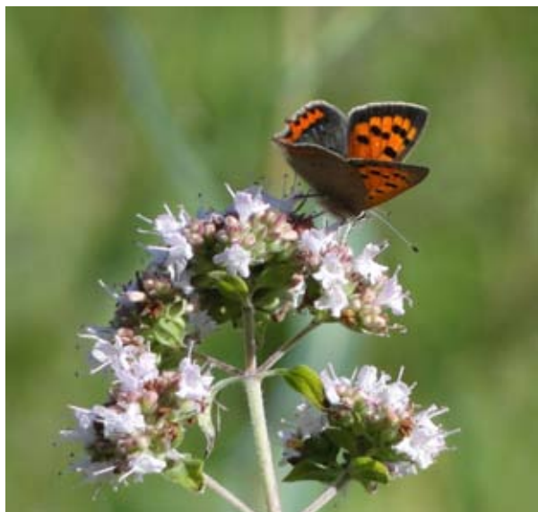
van Wilde marjolein met Kleine vuurvlinder.

Veel van de bermen in het buitengebied worden echter beheerd door Provincie, Waterschap of Het Utrechts Landschap en dan is het resultaat wat wisselend afhankelijk van de beheersmethode. Op delen van de Grebbedijk lopen langdurig schapen en dan zie je weinig bloemen meer. Dat is uiteraard een goedkope methode. Het Utrechts Land- schap heeft gelukkig onder langs de Grebbe- berg ook al delen gemaaid en aldus de verruiging en opslag van bomen en struiken wat kunnen doen stoppen. Dan zie je direct meer leuke flora, bijvoorbeeld een plotse toe- name van Wilde marjolein waar vlinders (zoals de Kleine vuurvlinder) en bijen graag op vliegen!