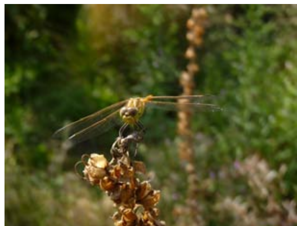
Steenrode heidelibelle op uitgebloeide Fingerhoedskruid.