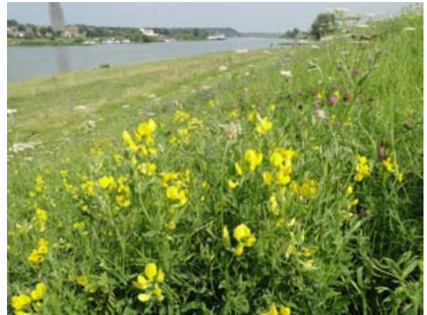
Veldlathyrus bij Lienden tegenover Rhenen.