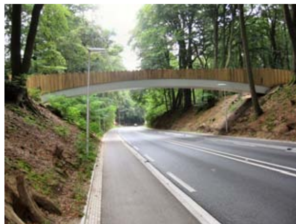
Het ecoduct. Op de foto is te zien dat de boomtoppen elkaar niet meer raken.

Het aangepaste plan kwam met het voorstel om naast de rijbaan verhoogde fietspaden aan te leggen die met schuin opstaande randen gescheiden worden van de rijbaan.