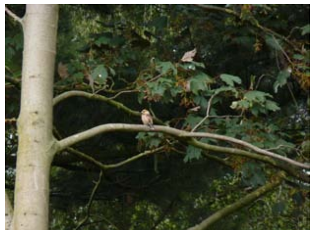
Appelvink in een Esdoorn.