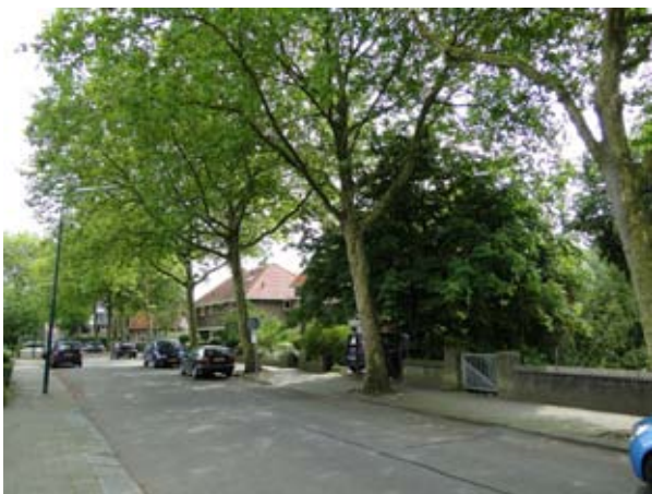
De Platanenlaan.

Het weghalen van de bomen en (deels) vervangen door jonge exemplaren of een andere kleinere boomsoort zoals elders in sommige Rhenense straten is gebeurd, vindt niet iedereen leuk. Toen een aanwonende van de Platanenlaan tegen de kapplannen protesteerde en handtekeningen ophaalde bij de andere aanwonenden bleek dat ook dezen dit in meerderheid niet wensten! Ook al geven deze grote bomen met hun brede kronen veel schaduw en vallen er in de herfst veel grote bladeren en uit elkaar vallende vruchtbolletjes. Toch wil men liever het fraaie aanzicht van de straat niet missen.